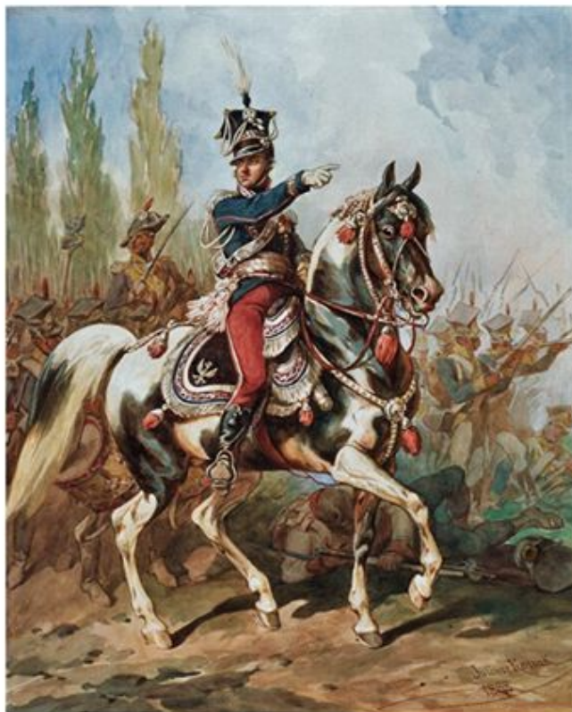
Gen. Jan Henryk Dąbrowski na czele Legionów

Hymnem Rzeczypospolitej Polski jest "Mazurek Dąbrowskiego". W 1797 roku poeta Józef Wybicki napisał "Pieśń Legionów Polskich we Włoszech", którą na cześć generała Dąbrowskiego nazwano "Mazurkiem Dąbrowskiego". Początkowo hymn składał się z 6 zwrotek. 26 lutego 1927 roku Ministerstwo Spraw Wewnętrznych ogłosiło, że jest to hymn Polski.