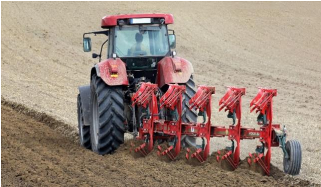
PŁUG DO ORANIA